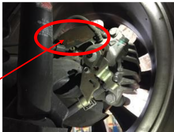
شکل 1 - گردگیر ترمز عقب

داغ شدن بیش از حد رینگ عقب، متصاعد شدن دود سفید از دیسک ترمز چرخ عقب و یا سرخ شدن دیسک ترمز هنگام رانندگی معمولی با خودرو که اثر آن به صورت سوختگی قابل رویت در پوشش رنگی گردگیر ترمز عقب می باشد (شکل 1)